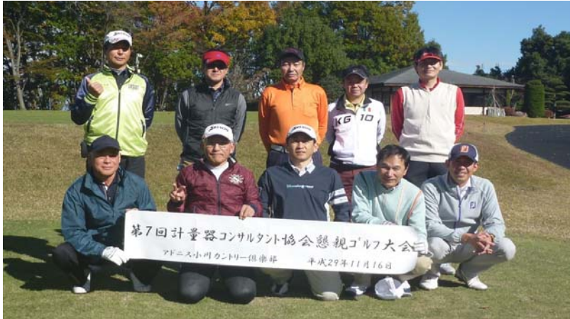
参加プレイヤーで、記念撮影。

参加者は当協会員が5名(うち1名は代打)、(一社)日本計量振興協会から2名、(一社)東京都計量協会から2名、メーカー1名の合計10名。